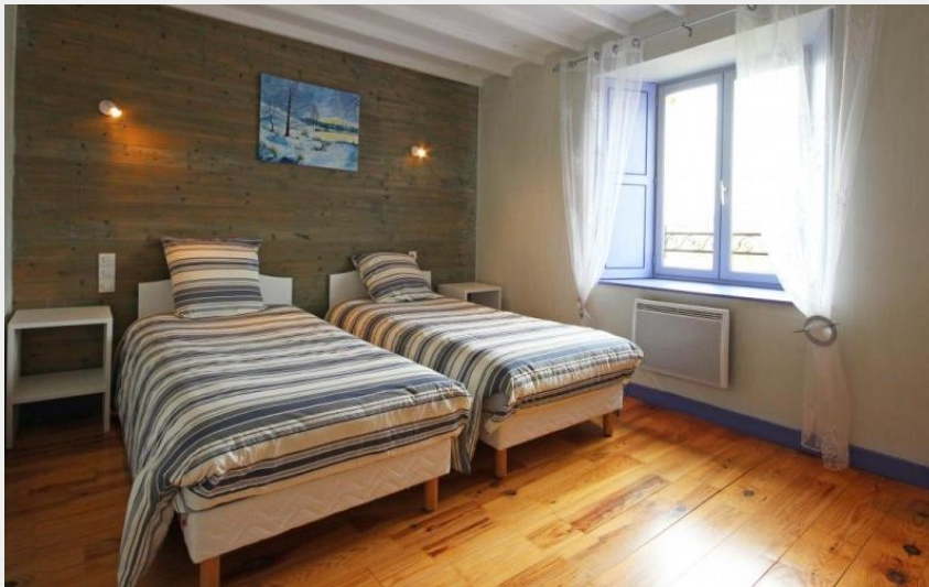
Crédit photo : Launay - Gîte des 4 saisons (© Gîtes de France Orne)