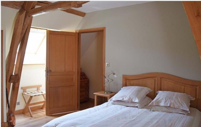
La Barbinière - Les Ferrettes