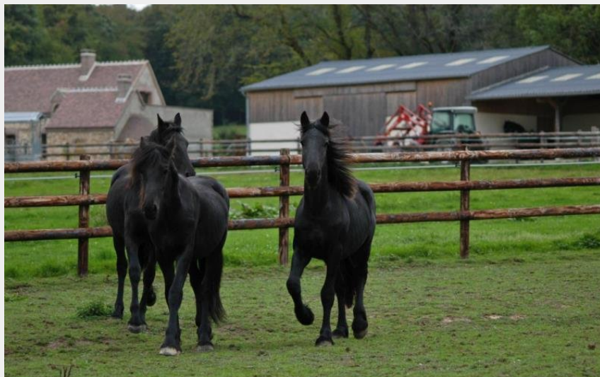
La Barbinière - Les Ferrettes