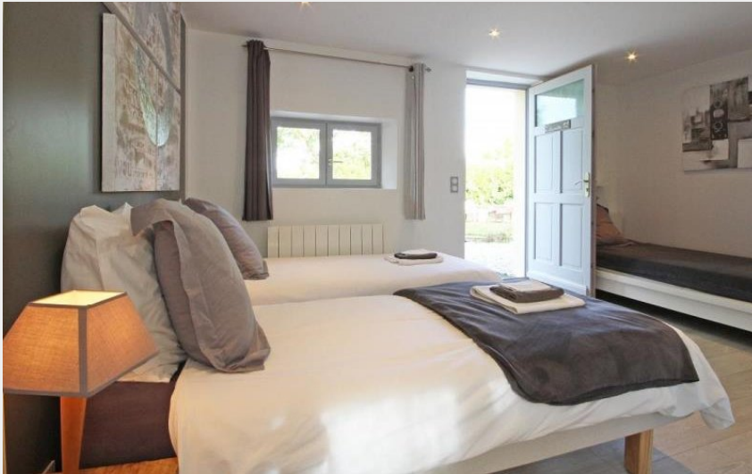
Crédit photo : Champvillon - Pause Champêtre (© Gîtes de France Orne)