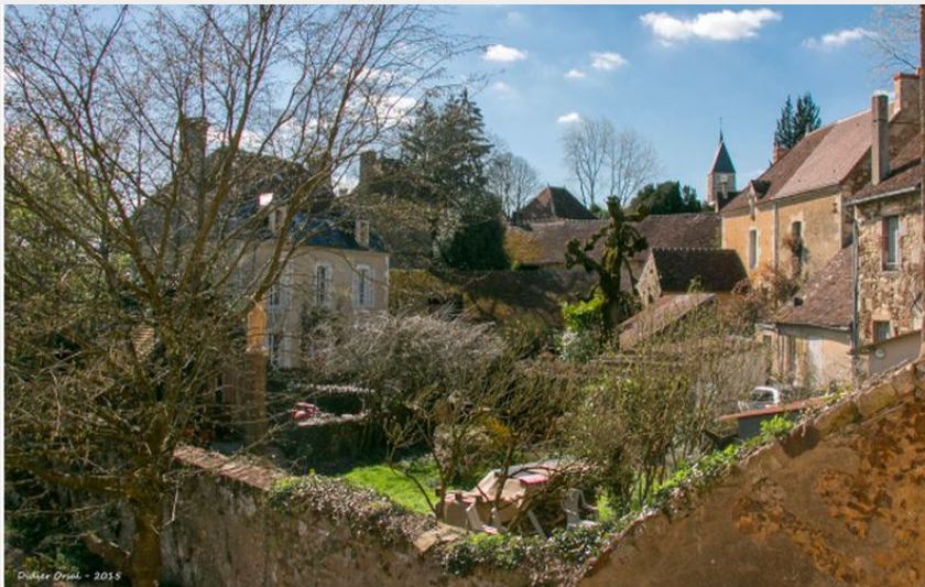
Crédit photo : Le-Clos-de-la-Fuie-La-Perriere (© MME JUIN DE FAUCALLE)