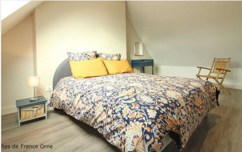
Gîtes de France Orne