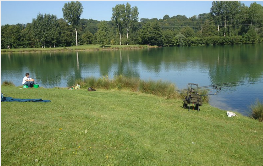
Plan d'eau de la borde