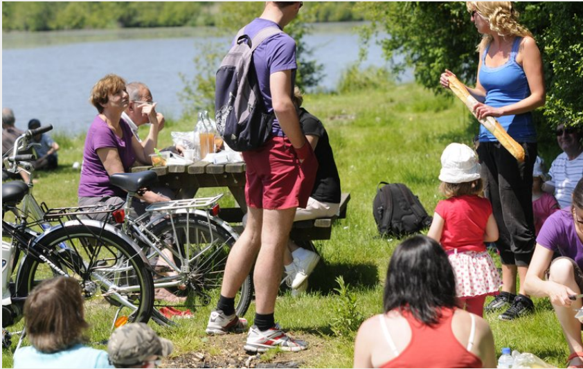
Table de pique-nique Vichères