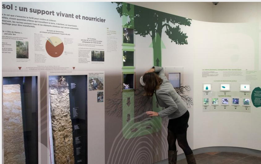
Crédit photo : Château de Senonches (Patrick FORGET - www.sagaphoto.com )