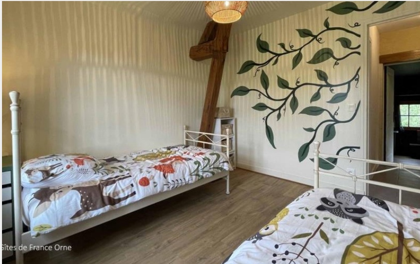
Gîtes de France Orne

Crédit photo : Le Vieux Pressoir (© Gîtes de France Orne)