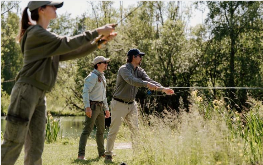
Pêche à la mouche - Moulin de Gémages