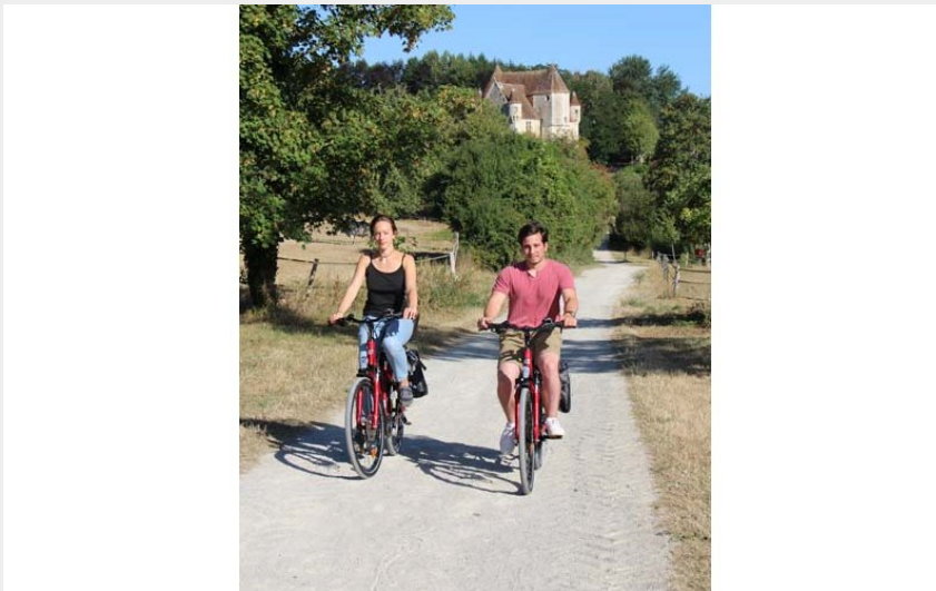
Location de vélos au Parc naturel régional du Perche