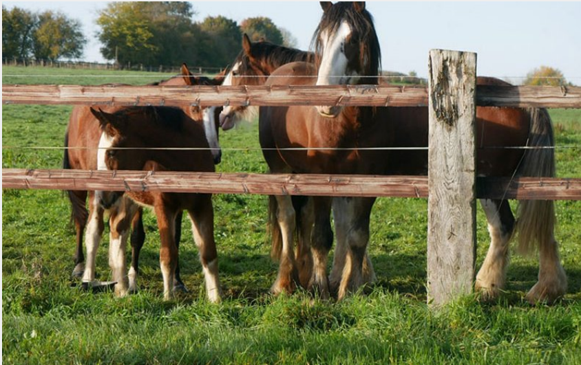
Crédit photo : Les Chevaux d'Abbecourt © Nicolas HODYS (© Nicolas HODYS)