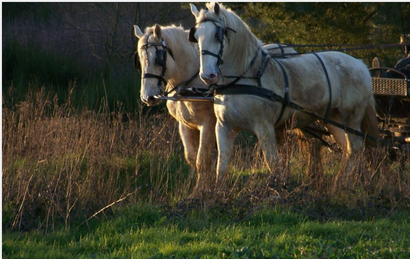
Crédit photo : Attelage naturaliste dans le Perche (© Céline Maudet)