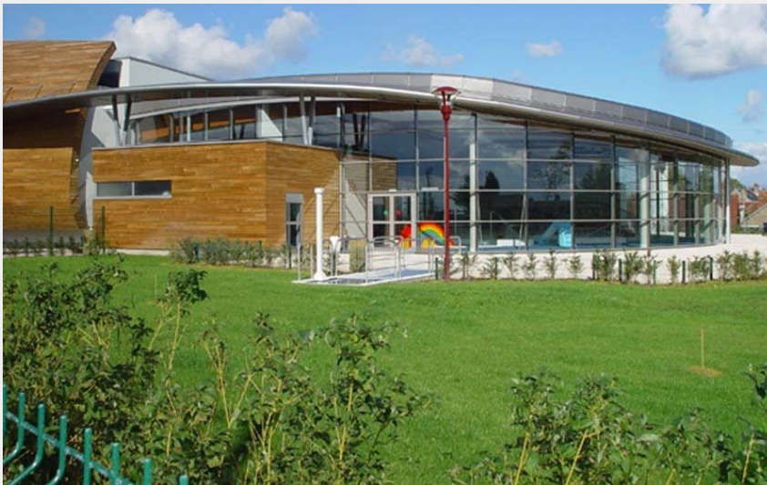
Piscine de Mortagne au Perche