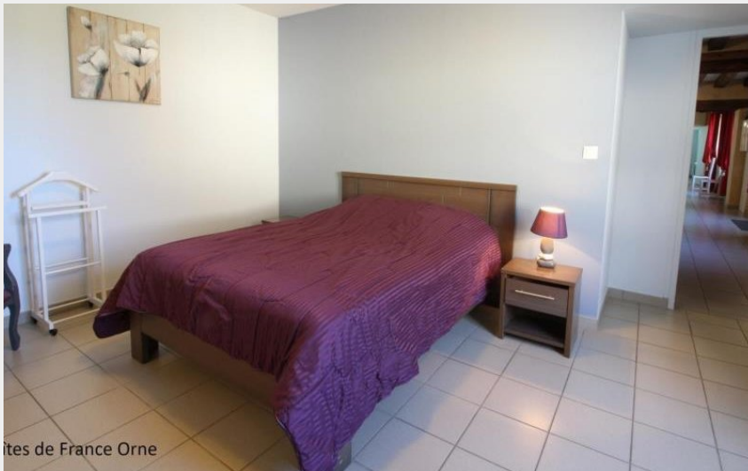
Gîtes de France Orne

Crédit photo : Le Vieux Moulin (© Gîtes de France Orne)