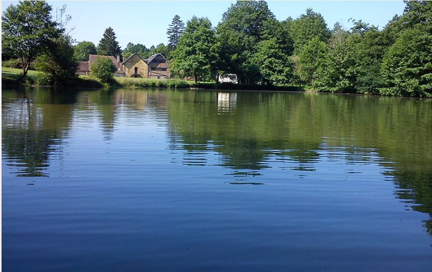
Crédit photo : Moulin-des-Sablons-1 800x600 (© Camping Le Moulin des Sablons)