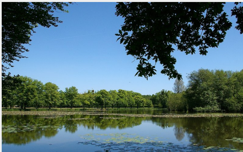
Printemps dans le parc du château de La Ferté-Vidame.