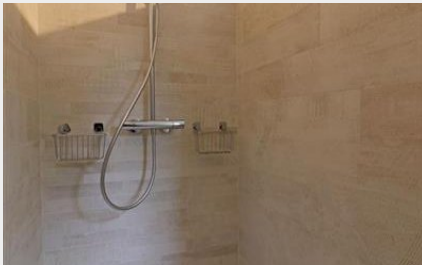
Crédit photo : Gîte de France Aux Petits bonheurs (© Gîtes de France Orne)