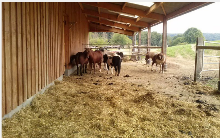
Crédit photo : Les Petits Cavaliers - La Chapelle Montligeon (©Orne Tourisme)