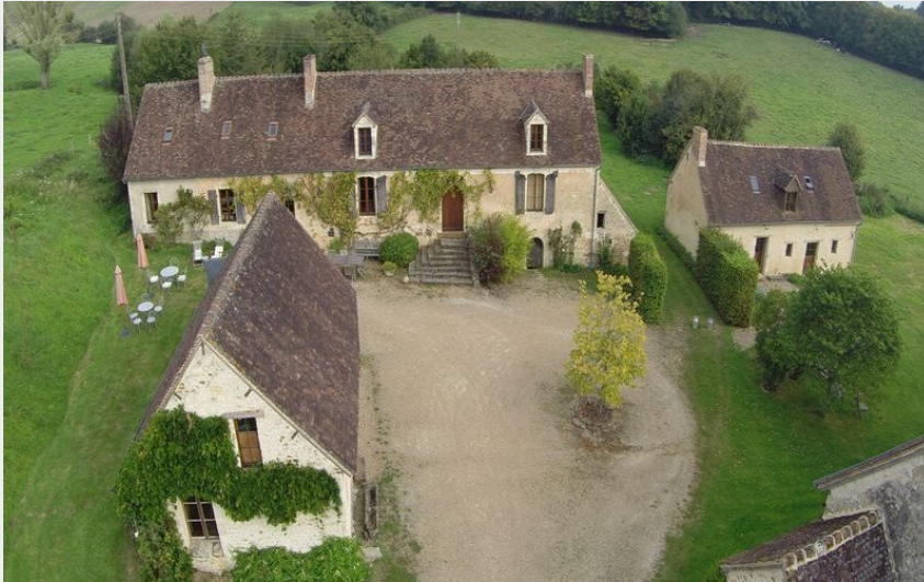
Hameau de la Lauseraie-Bellou-Le-Trichard