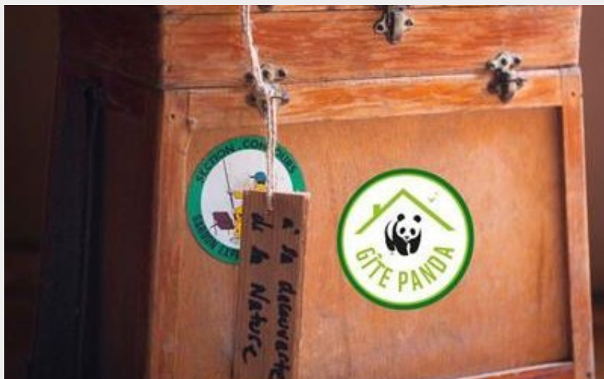
Crédit photo : Gîtes de France La Maison des Racines & spa (© Gîtes de France Orne)