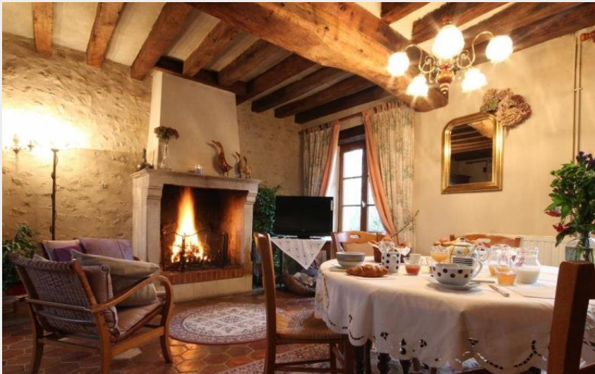
Crédit photo : Gîte de France Les Coudereaux (© Gîtes de France Orne)