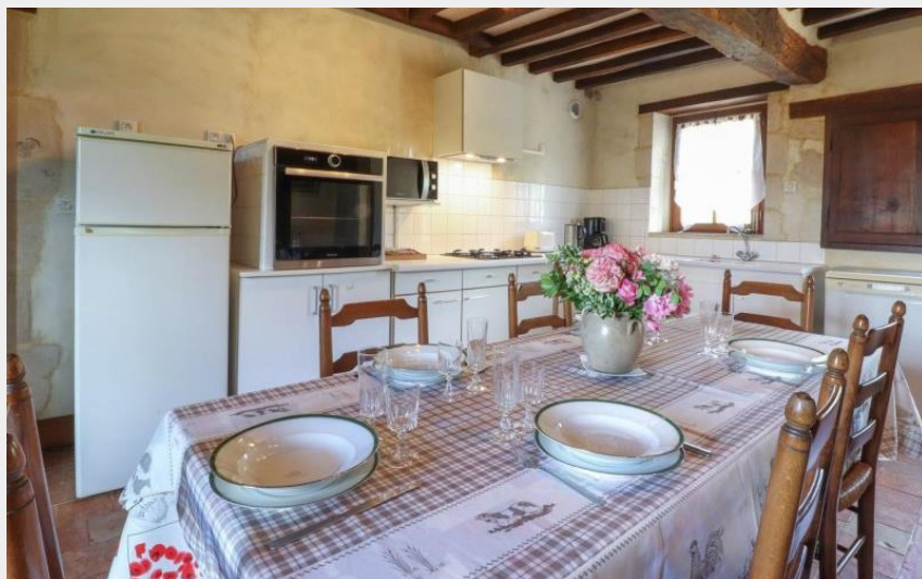
Crédit photo : Gîtes de France Le Haut Rivray (© Gîtes de France Orne)