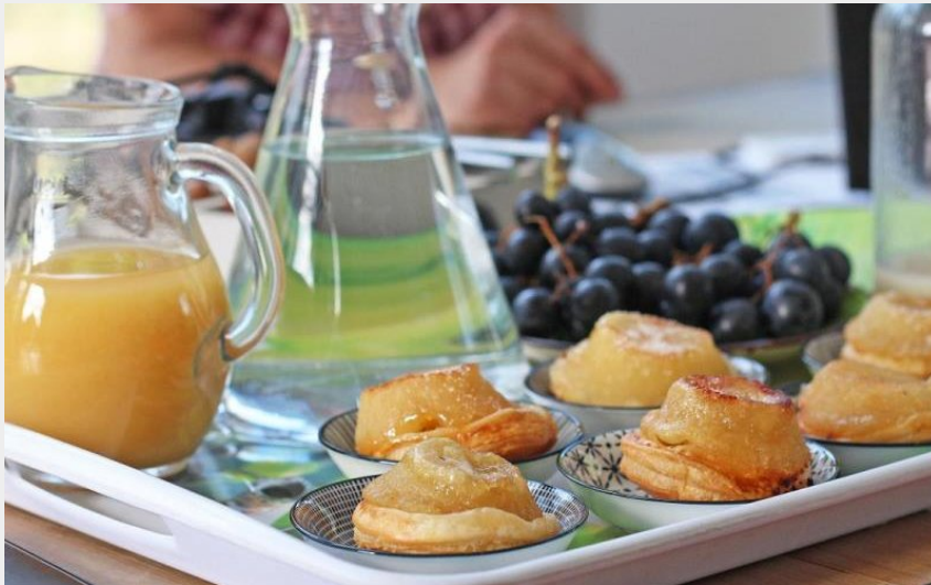
Champvillon - Pause Champêtre