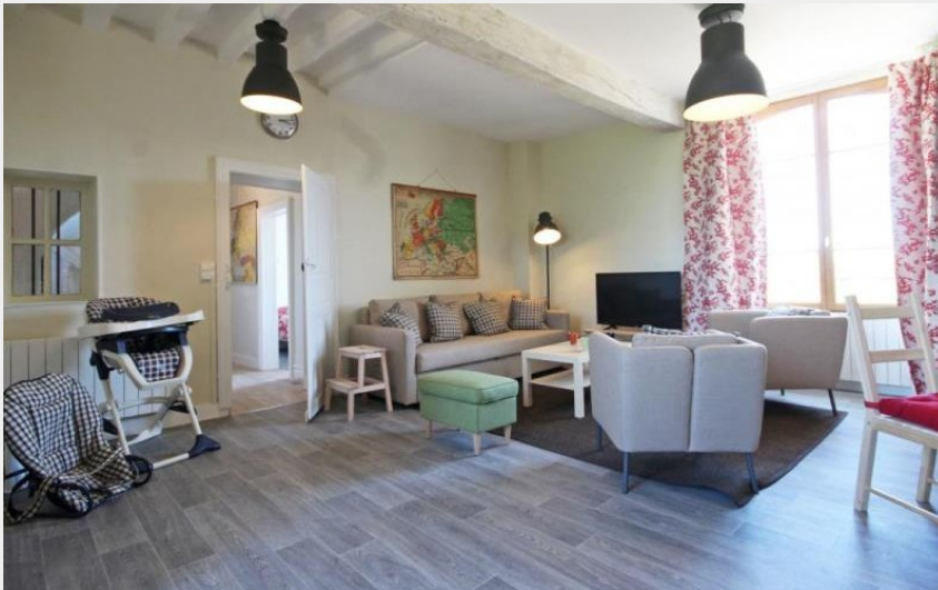
Gîte de France L'Ecole - Le bourg

Communauté de Communes des Collines du Perche Normand