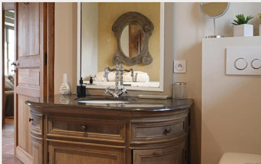
Crédit photo : Gîtes de France Le Clos Saint Paterne (© Gîtes de France Orne)