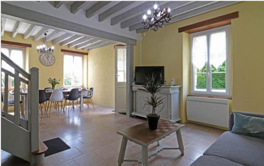
"Gite des Lilas"