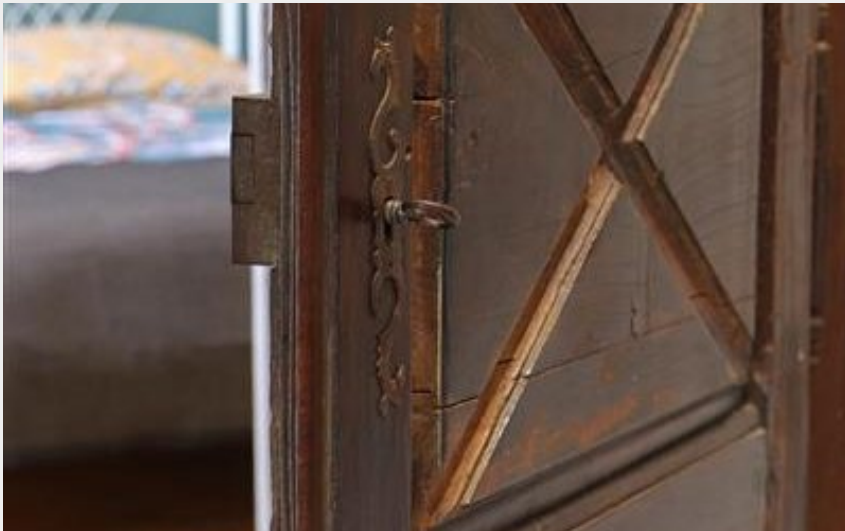
L'Hôtel Maréchal