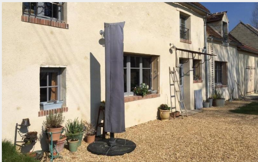
Crédit photo : Gîte de France Le Clos Pontillon (© Gîtes de France Orne)