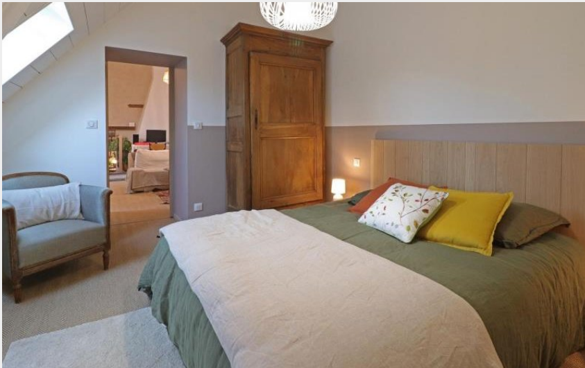
Crédit photo : Gîtes de France Le Clos Pontillon (© Gîtes de France Orne)