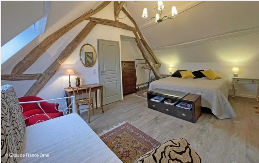
Crédit photo : Gîtes de France La Moncelière (© Gîtes de France Orne)