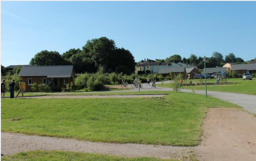
Gîtes de France Chalet du Perche N°7

Communauté de Communes du Pays de Mortagne-au-Perche