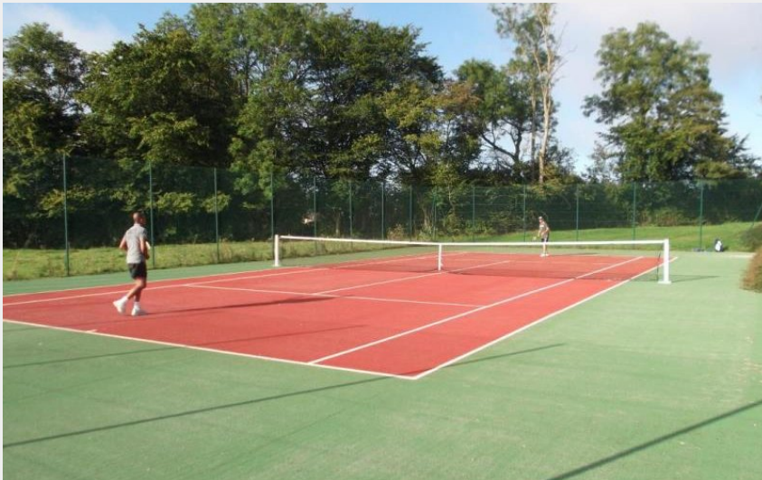
Gîtes de France Chalet du Perche N°11