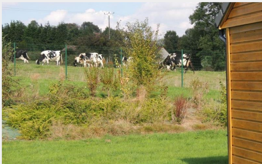
Crédit photo : Gîte de France Chalet du Perche N°9 (© Gîtes de France Orne)