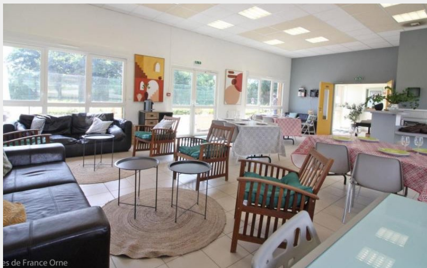
Gîtes de France Chalet du Perche N°9