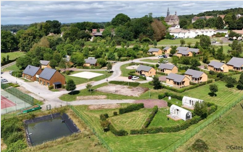
Gîtes de France Chalet du Perche N°15