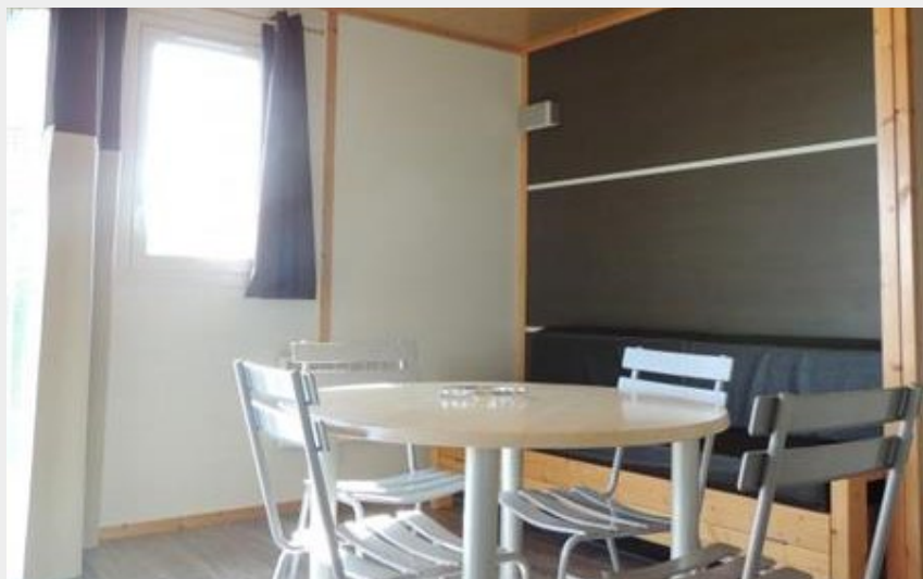
Crédit photo : Gîtes de France Chalet du Perche N°6 (© Gîtes de France Orne)