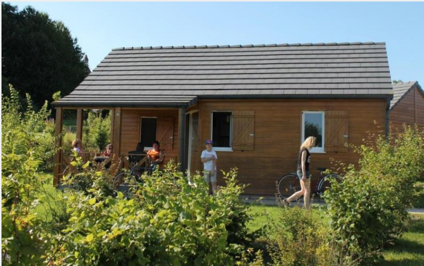
Crédit photo : Gîtes de France Chalet du Perche N°6 (© Gîtes de France Orne)

Communauté de Communes du Pays de Mortagne-au-Perche