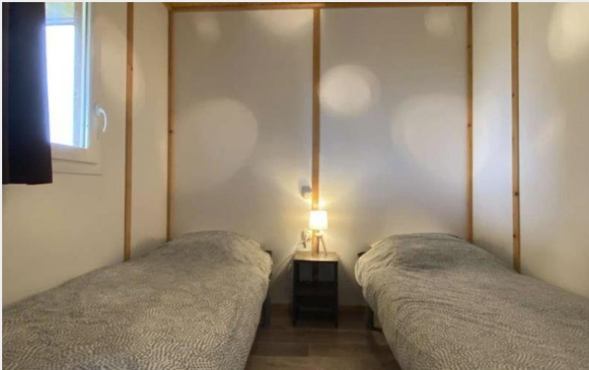
Crédit photo : Gîte de France Chalet du Perche N°1 (© Gîtes de France Orne)

Communauté de Communes du Pays de Mortagne-au-Perche