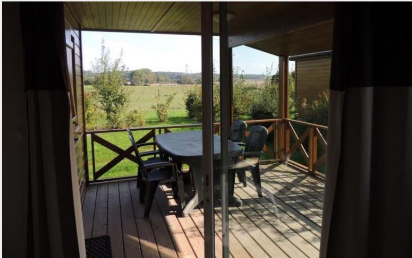
Crédit photo : Gîtes de France Chalet du Perche N°10 (© Gîtes de France Orne)