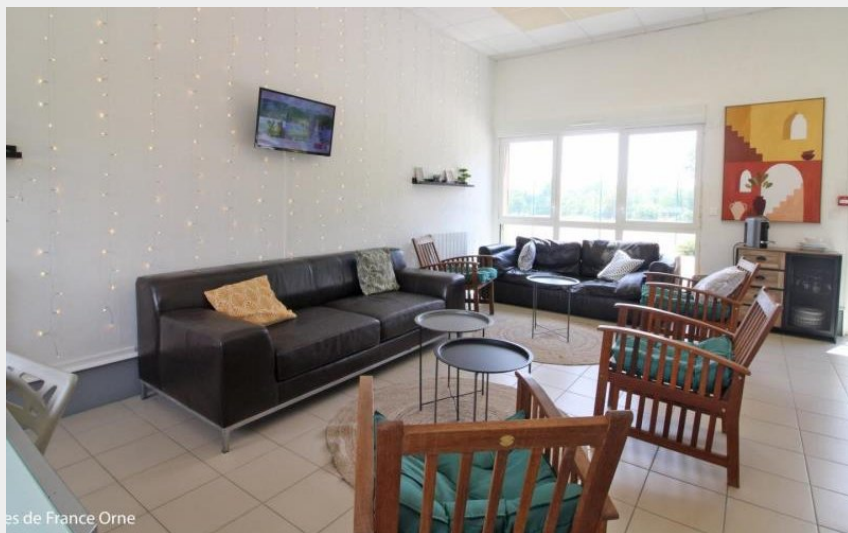
Gîtes de France Orne

Gîtes de France Chalet du Perche N°12