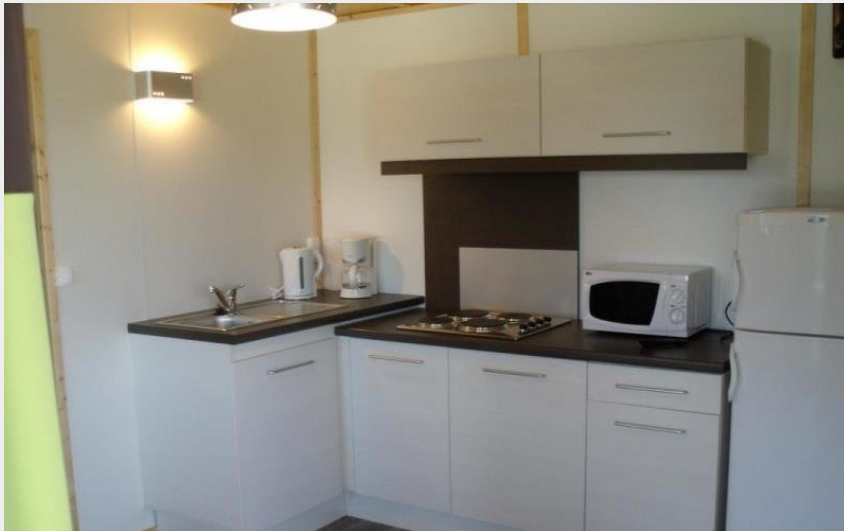
Crédit photo : Gîtes de France Chalet du Perche N°8 (© Gîtes de France Orne)

Communauté de Communes du Pays de Mortagne-au-Perche