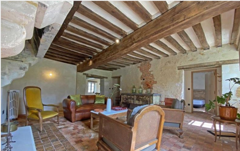
Crédit photo : Gîte de France Ferme de La Porte (© Gîtes de France Orne)