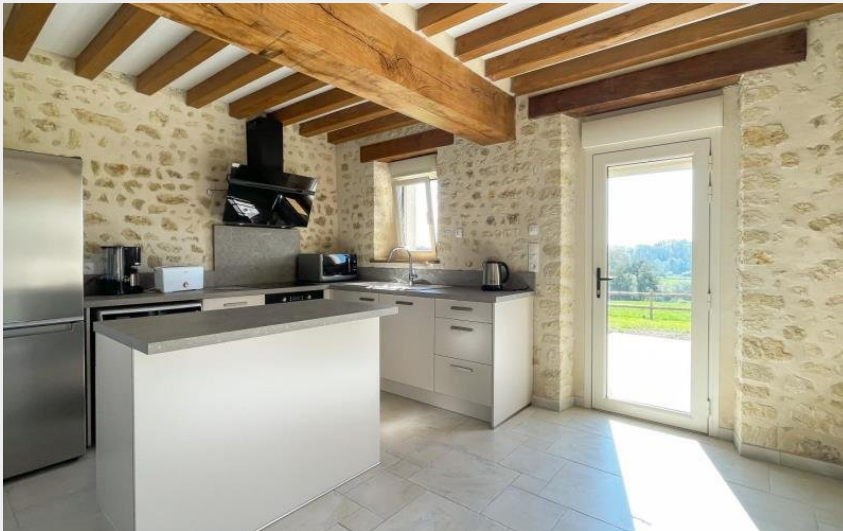
Crédit photo : Gîtes de France La Prévostière (© Gîtes de France Orne)