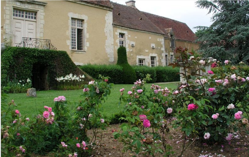
Jardins du Manoir du Pontgirard - Monceaux au Perche