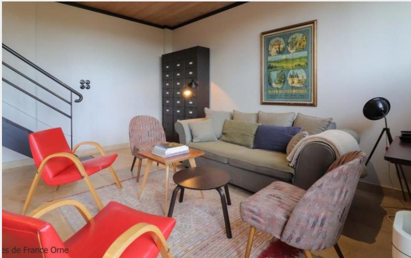
Gîtes de France Orne

Crédit photo : Gîte de France L'atelier de Bellême (© Gîtes de France Orne)