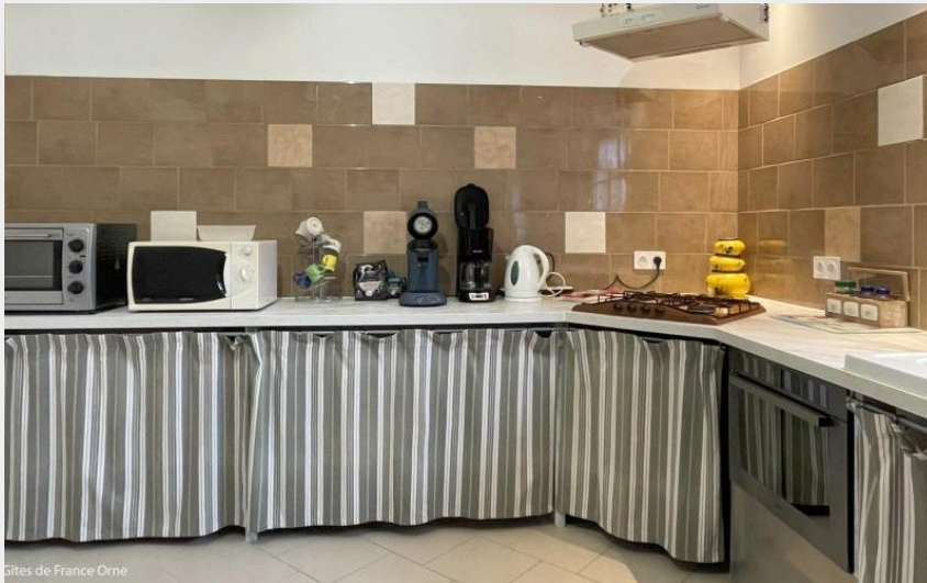
Gîtes de France Orne