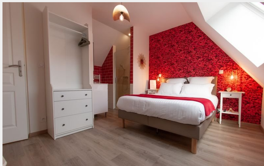
Crédit photo : Les-Clefs-de-la-Ferme-Coulonges-les Sablons (©ARMELLE PHILIPPE)