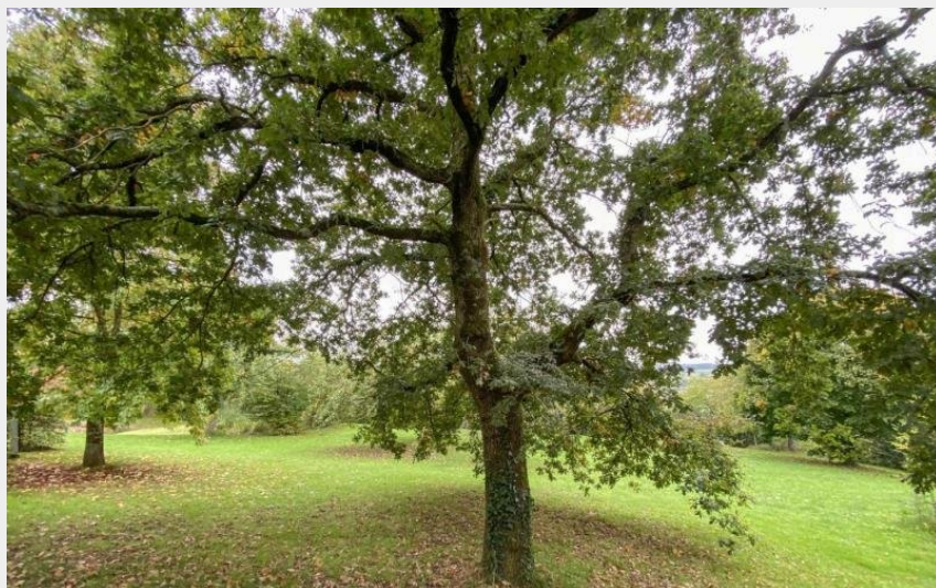
Gîte de France La Bretèche du Perche