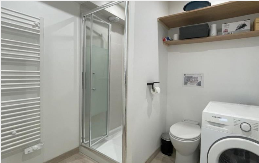
Crédit photo : Gîte de France Les Champs secrets (© Gîtes de France Orne)